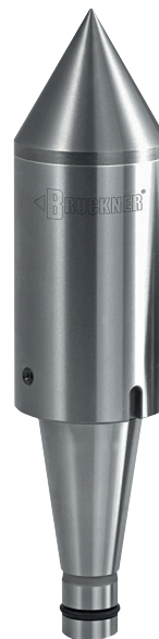
Steilkegel mit Vollhartmetall